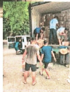
L'arrivo nella missione di Cebu City del container