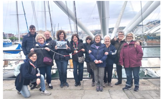
Altra tappa del tour al Porto Antico!