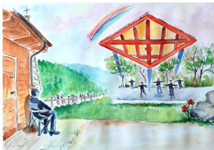
E... il sogno continua! (by Giovanna)

“Con i giovani, con fiducia”, questo è il titolo di un editoriale di Avvenire del 26 aprile sugli “Incoraggiamenti Pasquali” del Papa. Riporto con fedeltà alcune righe. “Gli educatori autentici, non si improvvisano. E per dedicare risorse agli oratori e ai giovani occorre un occhio lucido, lungimirante e generoso. È l’occhio di chi non ragiona sempre e soltanto in chiave mercantile.” E ancora: “Ogni epoca abbonda di adulti specialisti in sentenze drastiche, che sembrano godere nel “seppellire” generazioni di giovani... e se ce ne fossero occorre cortesemente e fermamente invitarli a levarsi di