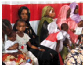
Un Centro pediatrico in Darfur. La nostra idea di pace.

Con questo progetto Emergency assicurerà assistenza sanitaria qualificata e gratuita alla popolazione di un'area vastissima, dando attuazione a un diritto umano fondamentale: il diritto