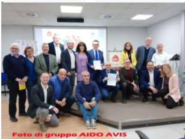
Foto di gruppo AIDO AVIS

AIDO Nazionale Via Cola di Rienzo, 243 00192 Roma Contatti Tel: 06.97614975 E- mail:aidonazionale @aido.it Pec: aidonazionale@aid opec.it