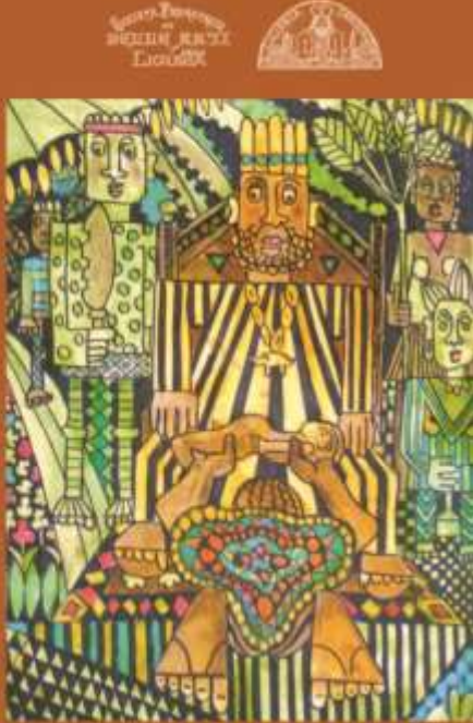
I SIMBOLI DEL POTERE in AFRICA Statue e...Racconti BAMBA YACOB Disegni