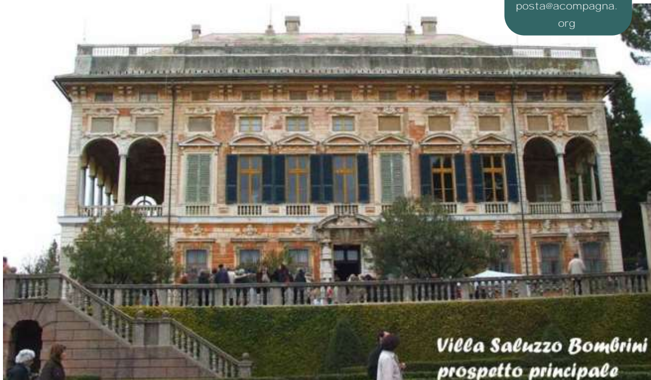
Villa Saluzzo Bombrini prospetto principale