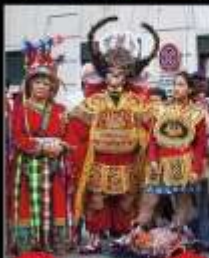
Chiostrò S. Andrea