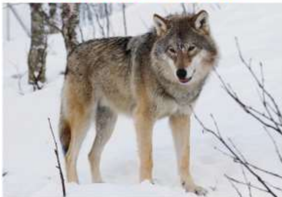
Lupo grigi americano

Ciclo di incontri in AUDITORIUM DELL'ACQUARIO