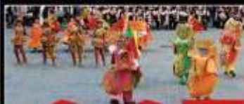
Calata Falcone e Borsellino