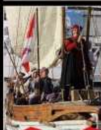
Calata Falcone e Borsellino