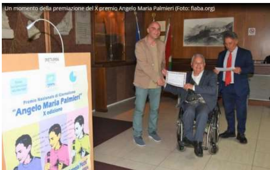
Un momento della premiazione del X premio Angelo Maria Palmieri

FIABA Onlus Piazzale degli Archivi, 41 – 00144 Roma 329 7051608 06 43400800 info@fiaba.org g www.fiaba.org