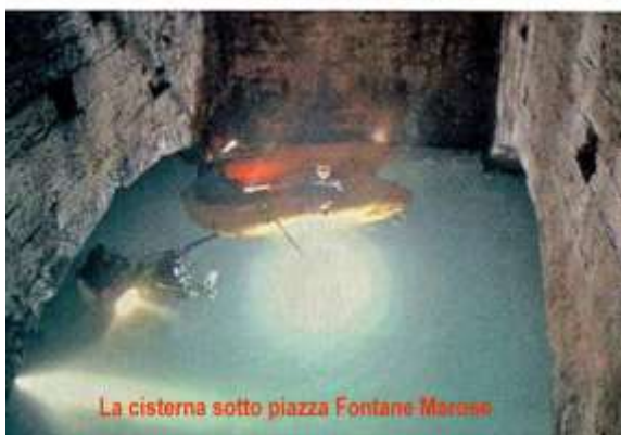
La cisterna sotto piazza Fontane Marose