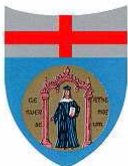
U.O. Clinica Reumatologica Università di Genova