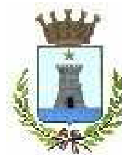
Città di Recco