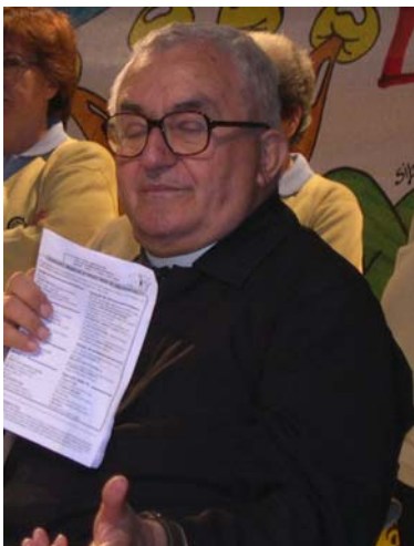
Don Benzi alla 7a Festa del Volontariato di "Millemani per gli altri" (2004)

N ato il 7 settembre 1925 a San Clemente in provincia di Forlì, don Benzi è entrato in seminario nel 1937 ed è stato ordinato sacerdote nel 1949. A lungo impegnato con i giovani, cui propone "un incontro simpatico con Cristo", nel 1972 ha guidato l'apertura della prima Casa Famiglia dell'Associazione Papa Giovanni XXIII a Coriano (Forlì).