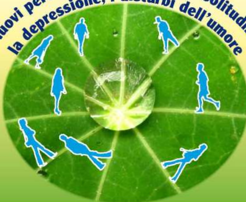
grafico: Enea Nappi/visualcommunication

Sabato 25 ottobre 2014 dalle 14.30 alle 19.00