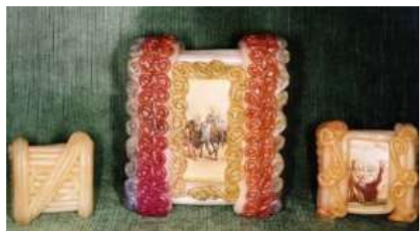
Gli ofiçieu detti a Chiavari mochetti

Per le rassegne fotografiche segui il link http://www.acompagna.org/rf/index.htm