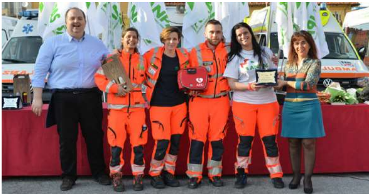
1° classificati Croce Verde Sestri Ponente (Ge)

https://www.flickr.com/photos/anpas-piemonte/sets/72157643502245775/