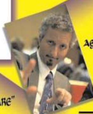
GABRIELE GENTILE il "mago da Legane" della tv