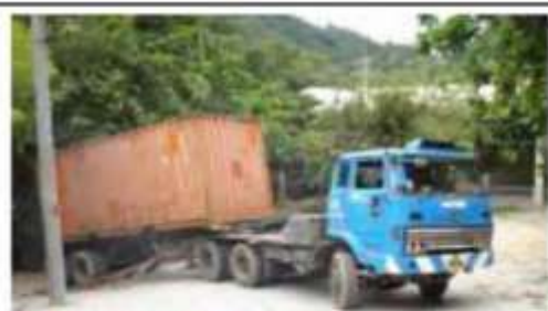
Il Container e' in preparazione per il 18esimo anno consecutivo