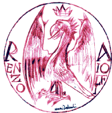
Associazione Culturale "R. Aiolfi" no profit - Savona

Istituto Zooprofilattico Sperimentale: 100 anni a tutela del consumatore.