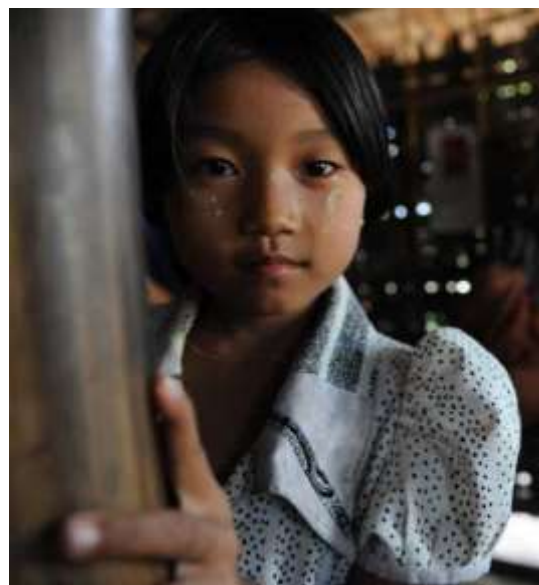
Proteggi una bambina: mettili in difesa!