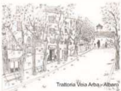
Trattoria Vegia Arba - Albaro

Info e prenotazioni: 010 363324 - 328422168 - 335 6902200