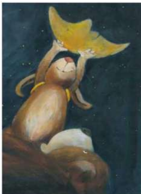
Illustrazione di Miriam Momi

Si ringrazia il Sistema Bibliotecario della Provincia di Genova per aver concesso l'uso del logo "La notte dei libri insonni"