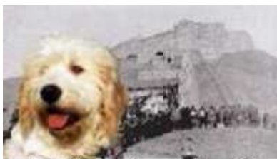
Nucleo Cinofilo da Soccorso "Sansone" Genova

D omenica 2 dicembre 2012 ore 16,00 c/o Starhotel President - Corte Lambruschini 4 (stazione di Ge Brignole) Genova. La conferenza è organizzata dal Nucleo Cinofilo da Soccorso "SANSONE", associazione di volontariato attiva a Genova dal 1997, si occupa di addestramento di Unità Cinofile da Soccorso, che operano nel campo della ricerca di persone disperse e persone sepolte da ma-