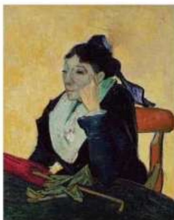
Vincent Van Gogh - L'Arlésienne

Il seminario conclude un ciclo di quattro dedicato a temi riguardanti la diagnosi e il trattamento precoce della depressione. In questa occasione saranno affrontati argomenti di grande interesse per la prevenzione, come la vulnerabilità, le interazioni gene-ambiente, il trauma, i fattori di rischio e quelli protettivi, il ruolo della famiglia e della scuola. La ricerca clinica ed epidemiologica ci ha fornito, nell'ultimo decennio, molte informazioni sulle quali i relatori aggiorneranno i partecipanti. La presenza di neuropsichiatri infantili e psichiatri degli adulti è il segno della necessità urgente di migliorare il raccordo degli interventi nelle diverse fasi della vita. Lo scopo del seminario è quello di legare le conoscenze scientifiche all'operatività dei servizi nel suo declinarsi quotidiano pieno di difficoltà.