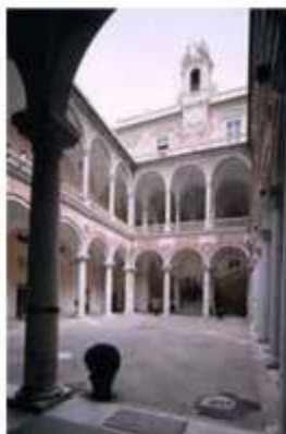
Palazzo Doria Tursi

Con il Patrocinio della SIP Società Italiana di Psichiatria Sezione Regionale Liguria