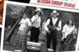
ALEXIAN GROUP (Italia)