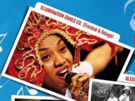
ILLUMINATION DANCE CO. (Trinidad & Tobago)

"Siate sempre lieti nel Signore!" (Filippesi 4,4) "Rejoice in the Lord always!" (Philippians 4:4)