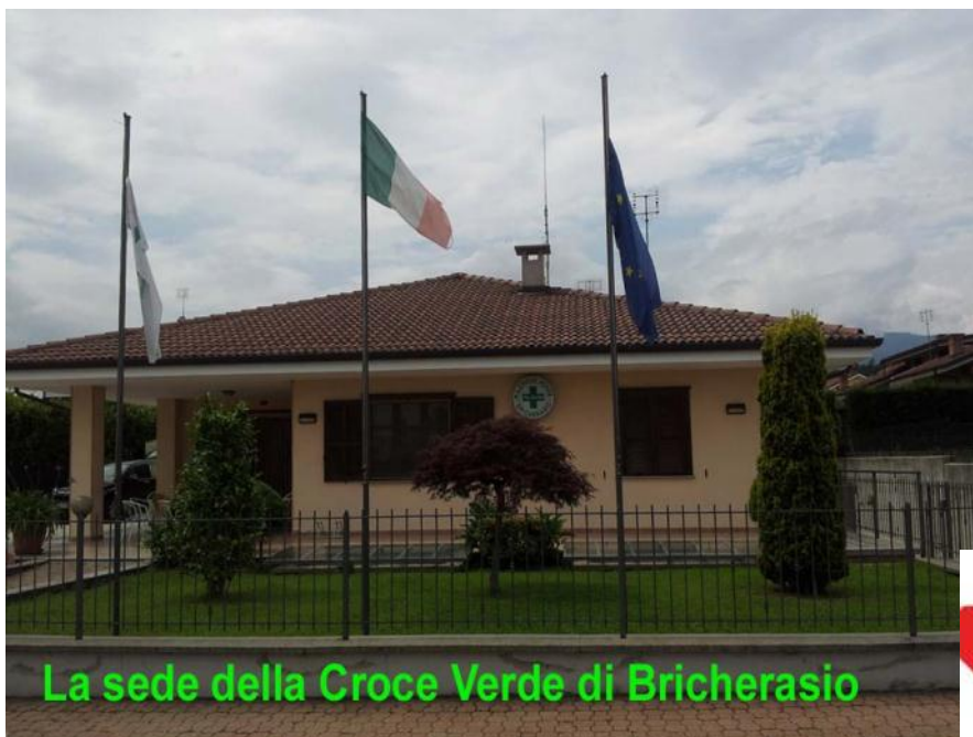
La sede della Croce Verde di Bricherasio

ro. La Croce Verde Bricherasio, associazione aderente all'Anpas, dal 1987 presta assistenza sanitaria alla cittadinanza svolgendo ogni anno quasi 5mila servizi divisi fra trasporti in emergenza 118, attività socio sanitarie e di accompagnamento con una percorrenza annua di oltre 210mila chilometri. Attualmente la Croce Verde Bricherasio si avvale dell'impegno di 140 volontari e 7 dipendenti, risorse fondamentali per una pubblica assistenza. Il parco automezzi è composto da sette autoambulanze, tre mezzi attrezzati per trasporto disabili e un'auto per servizi socio sanitari.