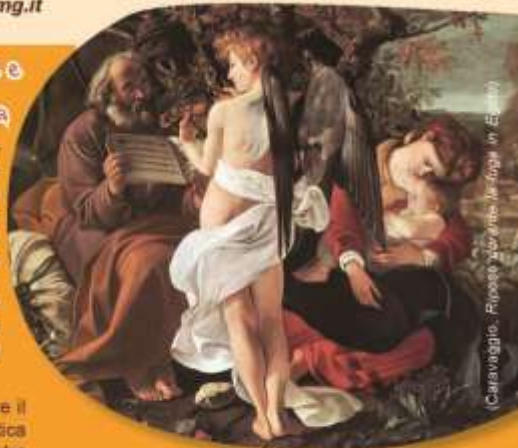
Caravaggio, Rucceolo che tiene la foglia in mano

Dalla Stazione ferroviaria: attraversare il sottopassaggio pedonale verso v. Antica Romana; voltando a destra, si incontra prima la chiesa e subito dopo la casa (5 min. a piedi).