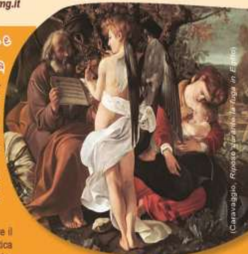
(Caravaggio, Riposo in fuga in Egitto)

Dalla Stazione ferroviaria: attraversare il sottopassaggio pedonale verso v. Antica Romana, voltando a destra, si incontra prima la chiesa e subito dopo la casa (5 min. a piedi).