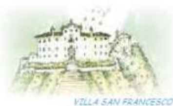
VILLA SAN FRANCESCO

Centro vacanze internazionale, casa per ferie e struttura di accoglienza per profughi.