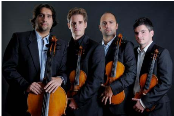
Quartetto di Cremona