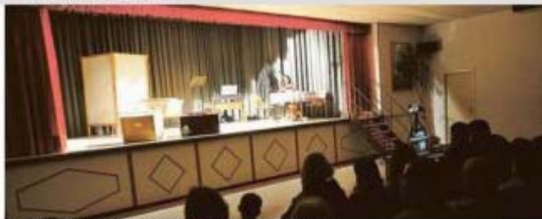
Teatro nel quale è stato portato in scena lo spettacolo sui problemi di comunicazione tra le coppie

«L'evento, unico nel suo genere perché unisce creatività e spettacolo e il mondo dello spettacolo di Internet per arrivare a quanti più possibile, si è tenuto nella nostra città»