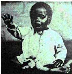
Fermati! La mia vita vale la tua

Diciamo "GRAZIE!" a chi vuol dare la sua adesione anche quest'anno, indipendentemente dalla provenienza e dall'età, regalando spontanea-