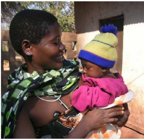
LVIA: Preveniamo il contagio dell'Aids da mamma a bambino