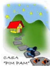
CASA FAMIGLIA "PIM PAM" Salita Gianelli n. 8 - 16043 Chiavari