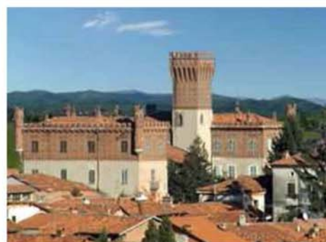
Associazione Amici del Castello di Candia

Associazione Amici del Congo Repubblica Democratica