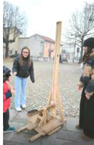
Prova la tua forza.

Mi ha colpita la parola "giociamo con niente". Proprio oggi, che se non si ha un cellulare, un computer o qualche oggetto tecnologico sembra non potersi divertire. Questi giochi del tutto gratuiti, dove chiunque può avvicinarsi (e questo è lo scopo dei ragazzi Rangers), vengono definiti giochi di strada o giochi di una volta.