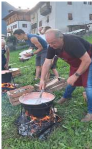
Preparazione della Mosa